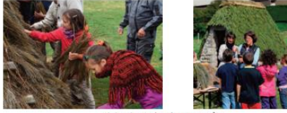
Animation sur la cabane en genêt

En cas de groupe nombreux, il est possible de doubler le groupe et de proposer les deux ateliers en alternance.