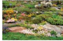
L'hort de Clastre